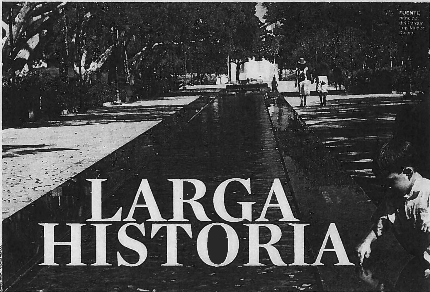
FUENTE principal del Parque Luis Muñoz Rivera.