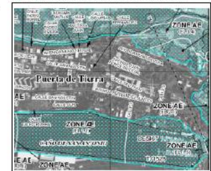
Mapa de Zonificación Hoja Número SD Vigencia 18 de Julio de 1991