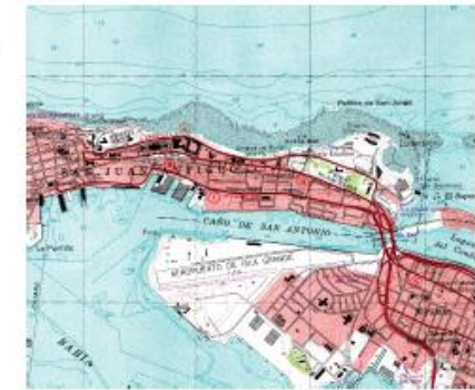
US Geological Survey Map DMA 1323 95-4685 E385 Photoreleased 1982