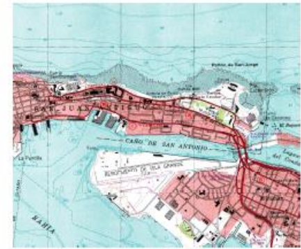
US Geological Survey Map DMA 1323 SE-Series E385 Photorevised 1982

LOS PLANOS ESTARÁN DISPONIBALES EN LA DIVISIÓN DE COMPRAS LA CUAL ESTA UBICADA EN EL PISO 14 DE LA OFICINA DE ADMINISTRACIÓN DE LOS TRIBUNALES, EDIFICIO 268 DE LA AVE. MUÑOZ RIVERA. FAVOR DE COMUNICARSE AL (787) 641-6276 PARA COORDINAR LA ENTREGA.