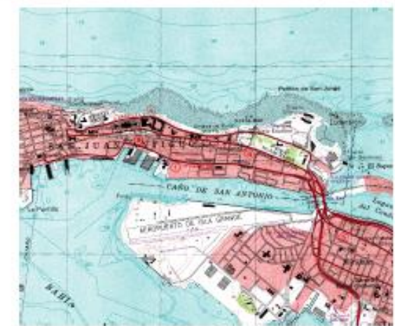
US Geological Survey Map DMA 1323 SE Series E385 Photorevised 1982